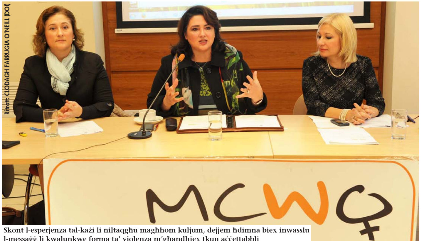
Skont l-esperjenza tal-każi li niltaqgħu magħhom kuljum, dejjem hdimna biex inwasslu l-messaġġ li kwalunkwe forma ta' vjolenza m'għandhiex tkun aċċettabbli